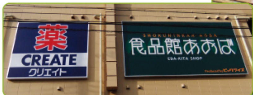
スーパー食品館あおば ・薬クリエイト